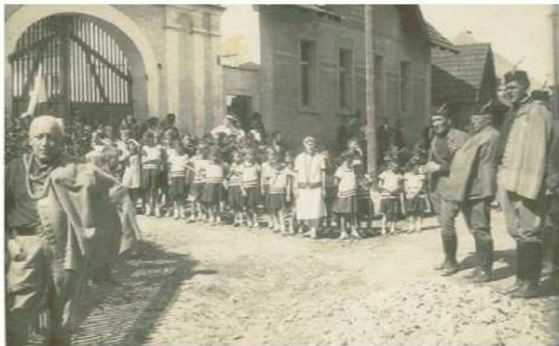
Nedatovaná slavnost Sokolů u památníku padlých