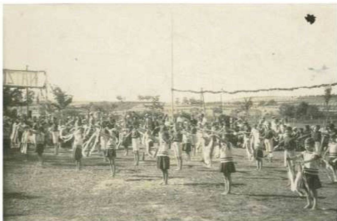
Hromadné cvičení Sokolů na louce (snad za "Myslivnou" - v místě současného č.p.178)