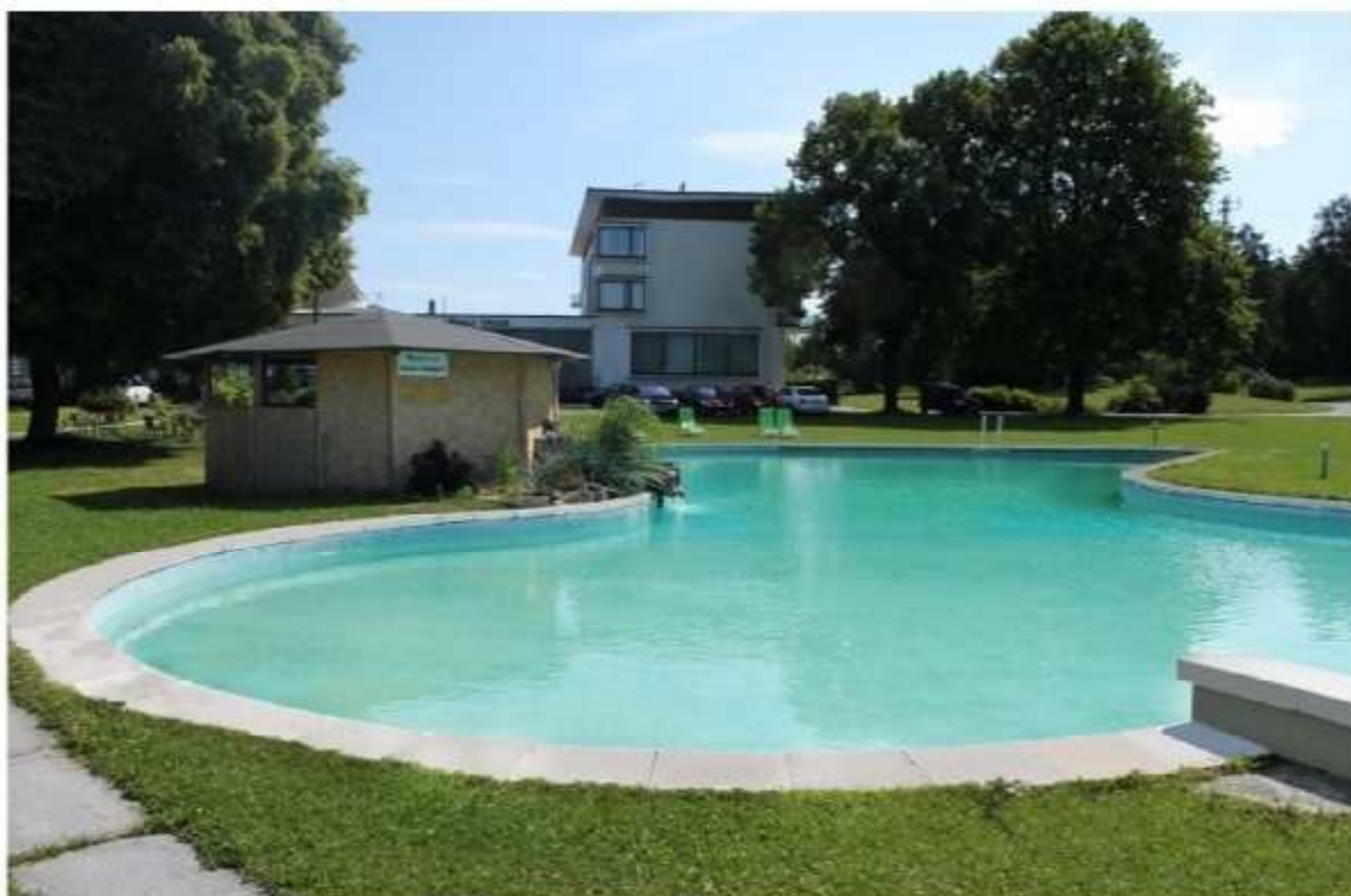
Poděkování vedení Hotelu Vystrkov za umožnění bezplatného použití bazénu pro kozárovické děti