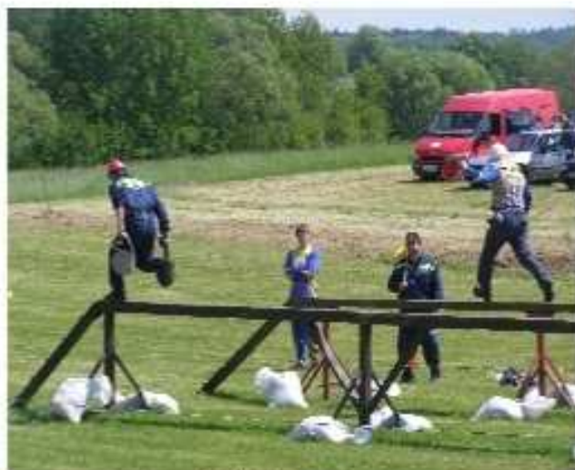
Bojovali jsme statečně, s nasazením všech sil ...