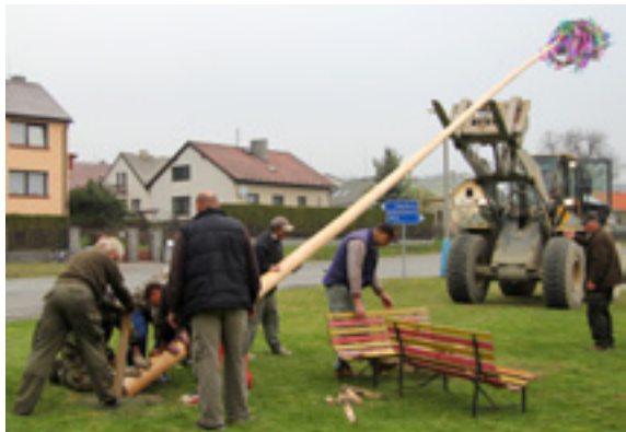
Hasiči staví máj

30. dubna před kulturní dům přiletělo několik čarodějnic, čarodějných pomocníků a jiná čeládka. Starší čarodějnice měly pro ostatní čarodějnou čeládku připraveno pár soutěží, vymetly své chýše a vzaly s sebou svoje domácí miláčky a nechaly ostatní děti si s nimi pohrát. Největší trpělivost měl obří pavouk Eda, po kterém děti házely metličky. Pro zahřátí si děti zahrály metličkovanou a samozřejmostí byla i malá odměna. Byla zde i možnost občerstvení a opečení buřtů. Dále jsme zkoukli postavení máje, kterou stavěl místní sbor dobrovolných hasičů. Ti zajistili i oheň na kopci, na který po celou dobu dohlíželi. Díky patří Obecnímu úřadu Kozárovice za poskytnutí přistávací plochy, děvčatům z TJ Sokol a dalším čarodějnicím za jejich aktivity. A také místním hasičům za máj a dohled nad ohněm. (Akce se konala za finančního přispění obce.) Štěpánka Černá