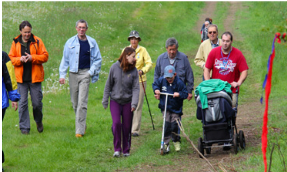
Kozárovickou dvacítku lze absolvovat i na koloběžce nebo v kočárku...